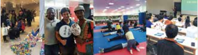
生命教育活動(左一圖) 外國學生體驗書法(左二圖) 急救安全教育(右二圖) 台塑企業徵才(右一圖)

本校致力推動身心健康促進計劃，舉辦健康體位(代謝症候群防治、闖關衛教)、菸害防制、性教育及愛滋週與急救安全教育等活動；每學年針對新生及將實習之學生進行心理量表篩檢，並培訓志工對需關懷學生實施宿舍訪視與電話關心，俾利學生適應生活、快樂學習。此外，也辦理多場生命教育活動與班級講座，全面提升學生品格學習。為能協助學生順利進入職場，辦理企業徵才說明會、企業參訪、產業職場講座、履歷自傳撰寫、求職面試技巧及勞動權益講座等就業講座。為營造溫馨的住宿環境，提供舒適的生活空間，辦理各種生活講座、宿舍藝文展等活動，共同營造優質宿舍氛圍。