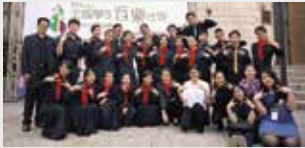
曉韻合唱團榮獲全國音樂比賽優勝