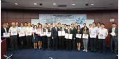
2017年本校與12大工業區服務中心建立產學合作平台