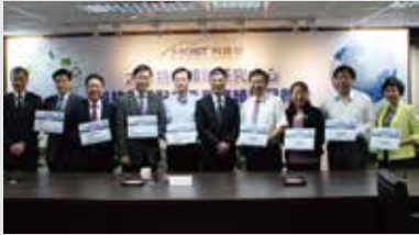
科技部公布重點補助大學特色領域研究中心

本校致力推動精準醫學、感染研究、人工智慧、巨量資料、健康老化及長照科技、細胞治療、醫學教育、生醫工程等跨領域研究，建立國際級研究中心，並深耕醫療科技之研發。與國際頂尖機構專家合作，如分子醫學研究中心「創新轉譯癌症研究及精準醫學」之研究成果，已達國際一流水準。本校亦持續參與美國「癌症登月」計畫，與世界頂尖團隊邁向攻克癌症之目標。新興病毒感染研究中心榮獲2018年科技部重點補助，持續推動感染性病毒研究。以科技產業及生技醫療應用為導向，孕育研發服務公司，並將學校培育之人才融入產業以符合國家及社會發展需求。