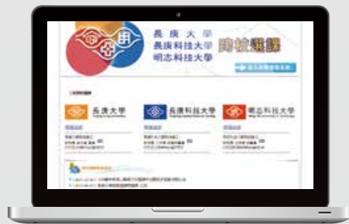
三校跨校選課系統