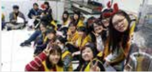
崇德青年社療養院服務學習