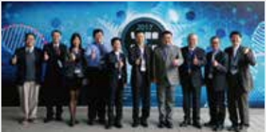
2017年本校主辦八校聯合智慧醫療與物聯健康技術發表會