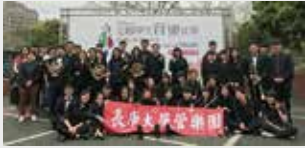
管樂團榮獲全國音樂比賽優等獎

為拓展學生之國際視野並促進校園多元文化發展，本校持續擴大招收國際生之規模。現就讀本校之外籍學位學生，共計180名。至本校短期交流之境外學生，包含短