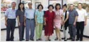
王品卉水墨創作展