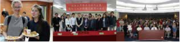
來自挪威之國際生(左圖) 生醫系與香港城市大學合作(中國) 國際生迎新餐會(右圖)

期研習、研修、見習或交換，共計82名。透過與國際生之交流互動，可接觸多元學習環境並體驗不同文化，豐富大學生活。並可帶給學生更寬闊的視野，提升思維之國際化與宏觀性。