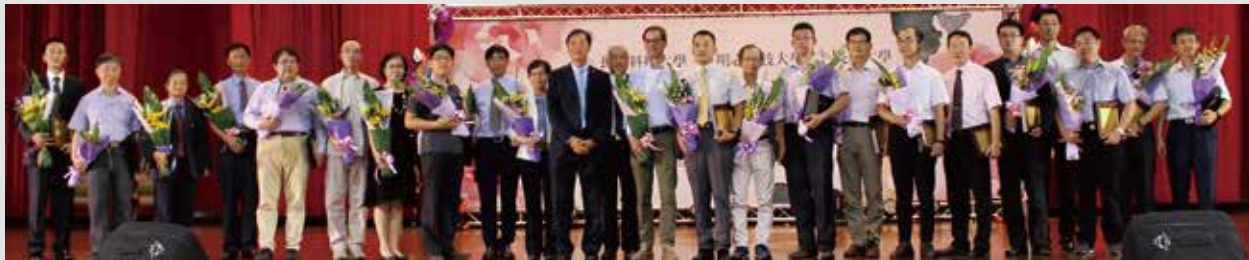
董事長楊定一教授參加106年度敬師暨表揚優良教師餐會

本校為發揚尊師重道精神，並表揚勤懇敬業及獎勵參與技術合作績效卓著之教師，以提升教學、研究、學生輔導及技術合作品質，每年選拔優良教師於教師節餐會表揚。本學年度獲獎優良教師共計26名，分別為：教學獎11名、研究獎7名、輔導獎6名、技合獎2名。